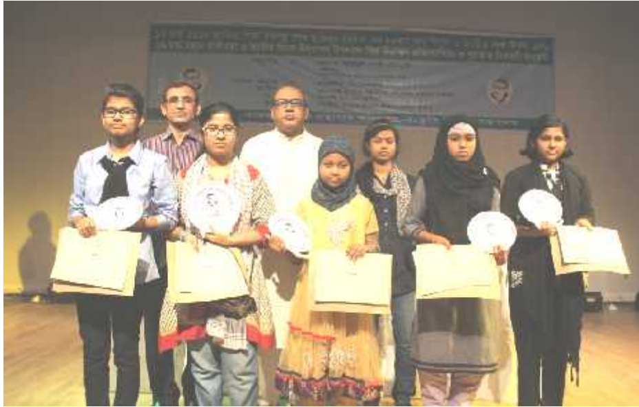
২৬ শে মার্চ মহান স্বাধীনতা ও জাতীয় দিবস ২০১৫ উদযাপন উপলক্ষে আরকাইভস ও গ্রন্থাগার অধিদপ্তর কর্তৃক আয়োজিত শিশু-কিশোর চিত্রাঙ্কন প্রতিযোগিতার পুরস্কার বিতরণী।