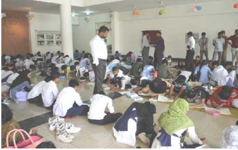
জাতীয় শিশু দিবস ২০১৫ উদযাপন উপলক্ষে আরকাইভস ও গ্রন্থাগার অধিদপ্তর আয়োজিত শিশু-কিশোর চিত্রাঙ্কন প্রতিযোগিতার একাংশ।