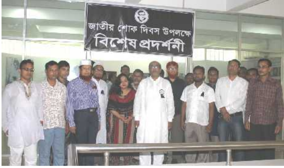
১৫ই আগস্ট ২০১৪ জাতীয় শোক দিবস পালন উপলক্ষে আরকাইভস ও গ্রন্থাগার অধিদপ্তর কর্তৃক 'বঙ্গবন্ধু ও বাংলাদেশ' শীর্ষক পক্ষকালব্যাপী বিশেষ প্রদর্শনী।