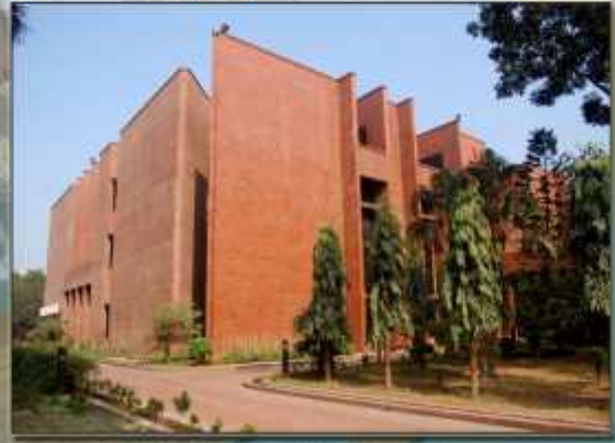
জাতীয় গ্রন্থাগার ভবন

আরকহিভস ও গ্রন্থাগার অধিদপ্তর সংস্কৃতি বিষয়ক মন্ত্রণালয়