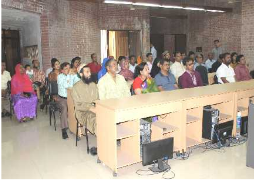
আরকাইভস ও গ্রন্থাগার অধিদপ্তরের কর্মকর্তা/কর্মচারীদের জন্য আয়োজিত অভ্যন্তরীণ (অন-জব) প্রশিক্ষণ