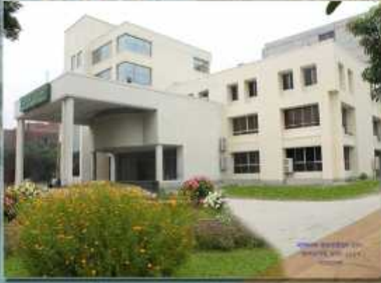
জাতীয় আরকহিভস ভবন